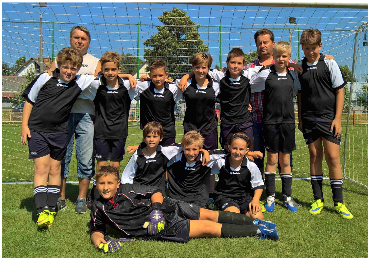
Obr. č. 2 – družstvo FK Horka – starší žáci