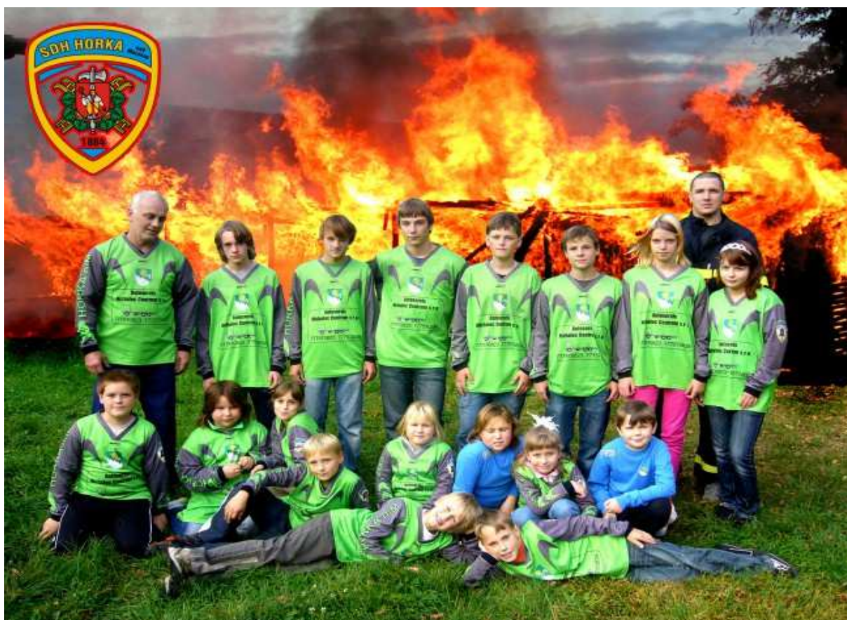
Obr. č. 6 – SDH Horka MH