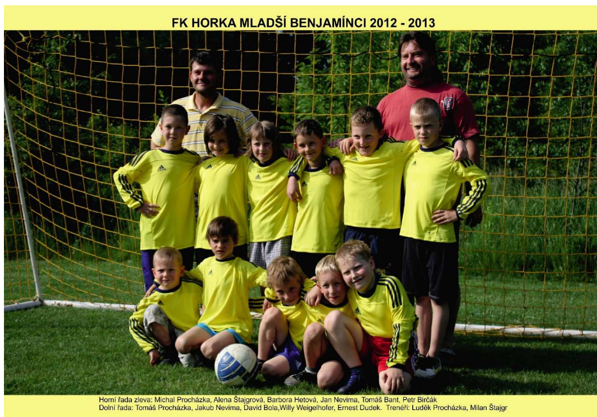
Obr. č. 1 – družstvo FK Horka – mladší benjamínci