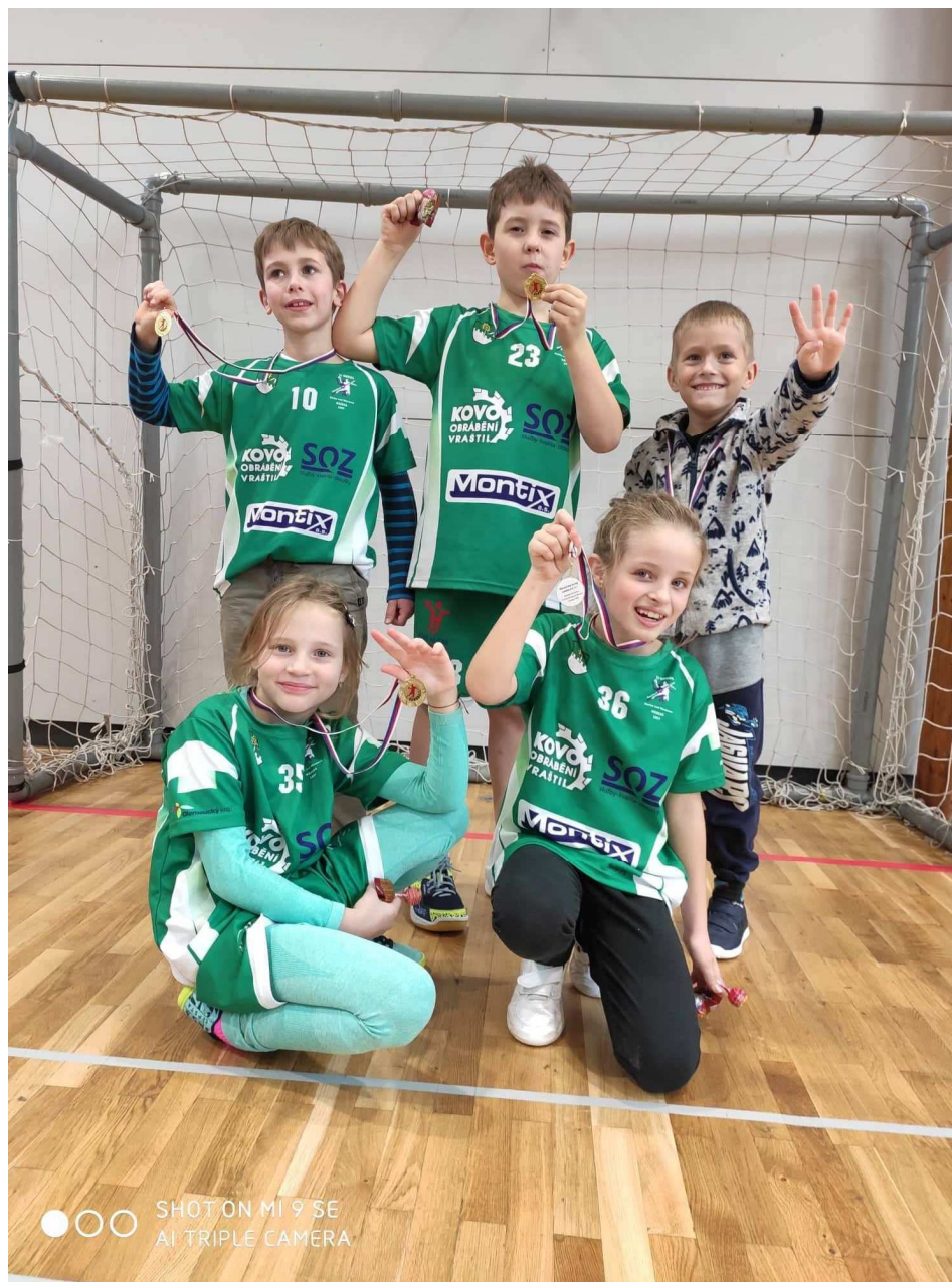
Obr. č. 4 – členové klubu Házená Horka - děti