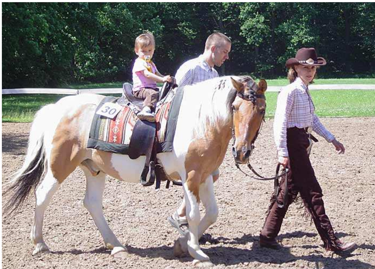
Obr. č. 8 – jezdeckví Lovecká chata Horka