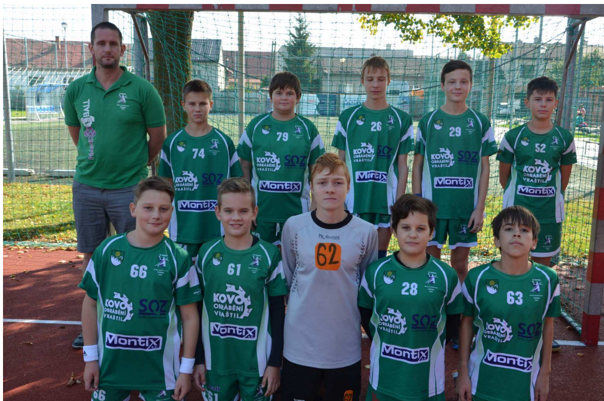
Obr. č. 5 – členové klubu Házená Horka – starší žáci