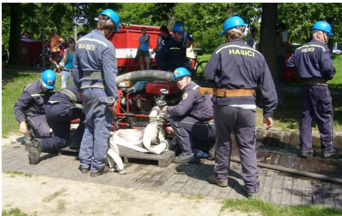
Obr. č. 3 – SDH Horka muži