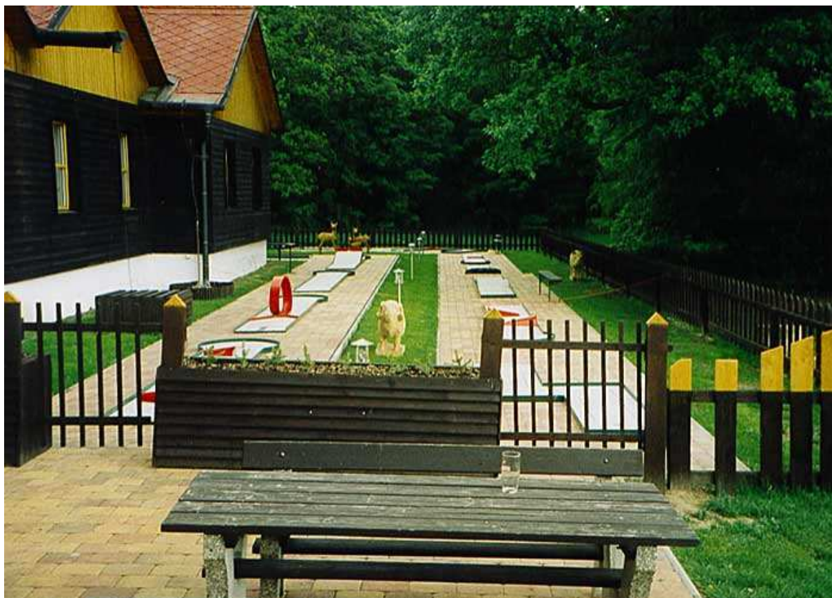
Obr. č. 7 – minigolf Lovecká chata Horka