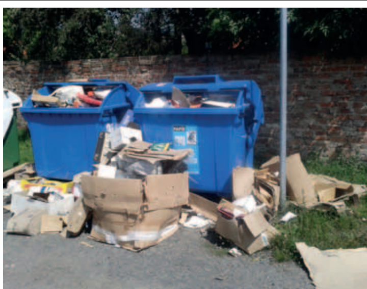
Nehezké zákoutí se často vytváří u kontejnerů na Olomoucké ulici. Přítom není problém zažádat na obecním úřadu o žlutou i modrou popelnici a mít ji přímo u domu. Pořízení i vyvážení je zcela zdarma.