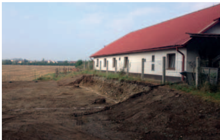
V těchto dnech začíná rekonstrukce a intenzifikace ČOV. Protože obec neuspěla se žádostí o dotaci, musí náklady ve výši 19 milionů zaplatit z vlastního rozpočtu. Pokusí se však o peníze zažádat znovu na počátku roku 2017.