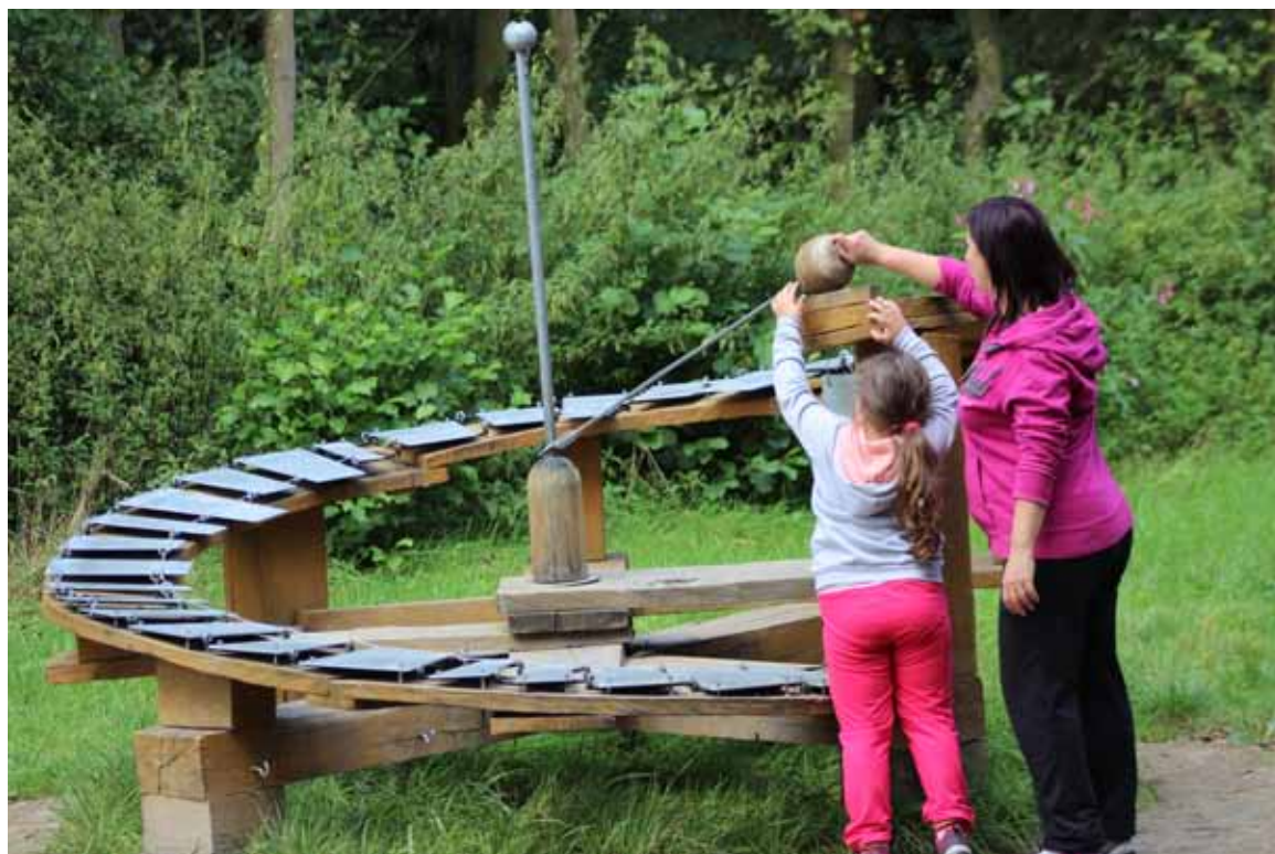
Xylofon v Kouzelném lese zvuků.

Sluneční paprsky pomalu prostupují skrz mraky a po dlouhé, mrazivé a tuhé zimě probouzí k životu celou přírodu. Na Sluňákově vítáme jaro mnoha akcemi, na které jste srdečně zváni.