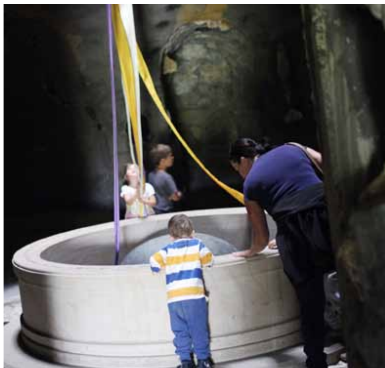
Nitro Sluneční hory snů.