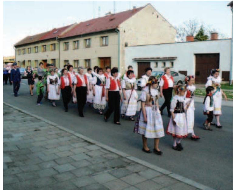
V rámci 70. výročí osvobození se konal v Horce nad Moravou průvod.

A přesto tady v Evropě, na starém kontinentě, vznikaly nejrůznější ideologie, byla zde spousta příkoří a emocí. Zárukou míru je tu dnes Evropská unie, jejímž cílem je poskytovat lidem prostor svobody, bezpečnosti a práva. Prostřednictvím Schengenu můžeme svobodně cestovat, seznamovat se s nejrůznějšími kulturami,