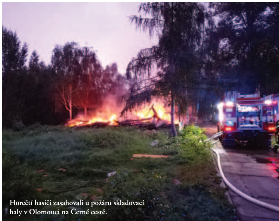
Horečtí hasiči zasahovali u požáru skladovací haly v Olomouci na Černé cestě.