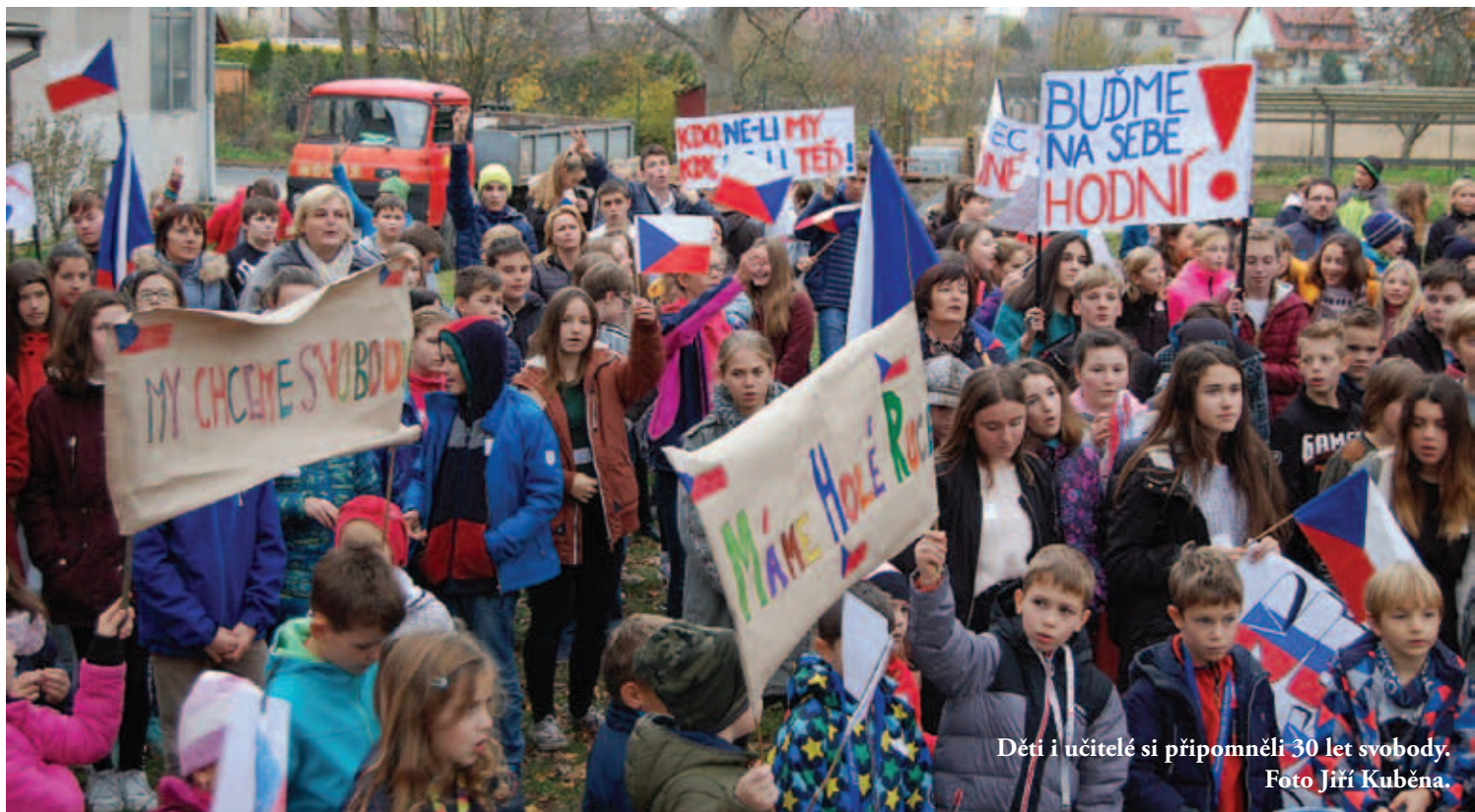
Děti i učitelé si připomněli 30 let svobody.

lidí, kteří byli donuceni k emigraci. Téměř celá škola se pak se svými učiteli sešla na demonstraci, kdy si zopakovali revoluci ze 17. listopadu 1989, zacinkali klíči a zazpívali Modlitbu pro Martu. -mv-