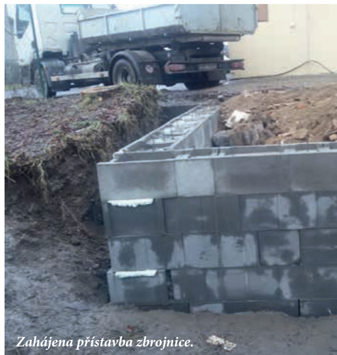
Zahájena přístavba zbrojnice.