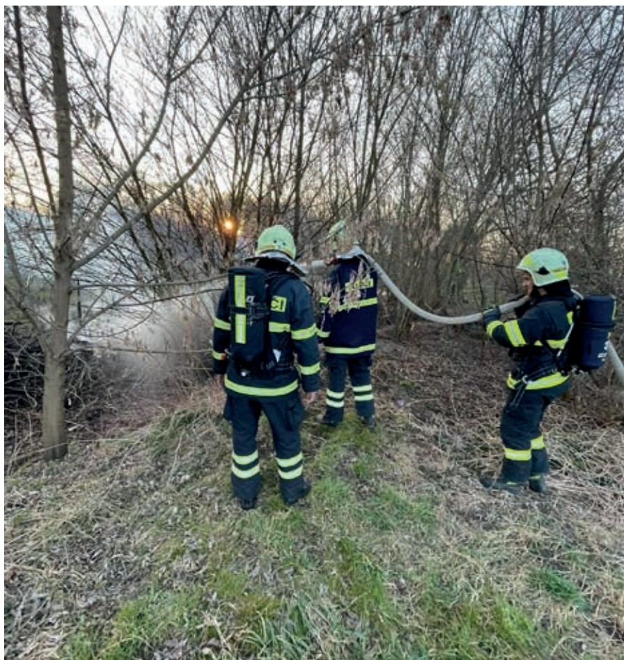
Hasiči zasahují u požáru travního porostu.

Za celý Sbor dobrovolných hasičů chci poděkovat všem našim členům za příkladnou a obětavou práci a našim rodinám, které nás neúnavně v této činnosti podporují. Velké poděkování patří především také zastupitelstvu obce, které každý rok významně podporuje naši činnost. Vám, občanům, pak přejeme pevně zdraví, hodně štěstí a v novém roce 2022 jen to nejlepší! Lukáš Klevar