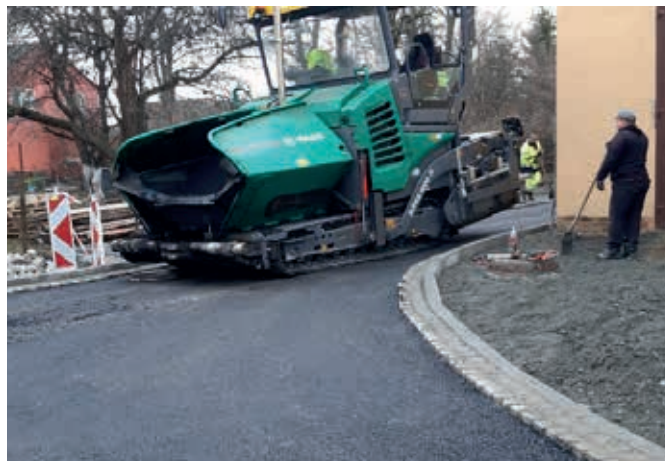
Rekonstrukce odpadového místa Albrechtova.