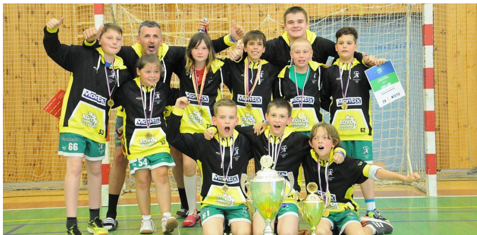
Družstvo vítězné TJ Sokol Horka nad Moravou.