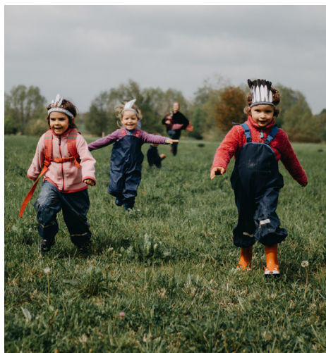
Lesní dětský klub Větvík má od září dvě volná místa.

Máme dvě volná místa. Po škole rovnou do lesa – to je heslo kroužku lesního dobrodružství, aneb lesní družiny pro děti 1. stupně ZŠ. Jak to funguje? Po obědě vyzvedávají průvodci děti před jídelnou ZŠ a vyrazí se. Nejprve si v maringotce nebo v týpí odloží školní brašny a převlečou se do terénnějšího oděvu. Následuje objevování okolí, stavba lesních chýší a jejich vylepšování, rozdělávání ohně, vaření, práce s nožem, sekýrou, ale i jemnější rukodělné tvoření. Nabídka aktivit je dobrovolná. S dětmi jsou vždy dva zkušení průvodci, děti se mohou spontánně rozdělit do skupin, které se zabývají tím, co je právě baví. Nechybí vybavení na poznávání přírody