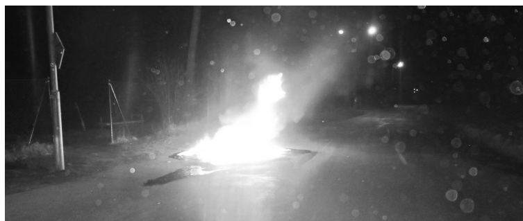
V neděli 9. 3. zapálil neznámý pachatel 3 kontejnery na tř. 1. Máje.