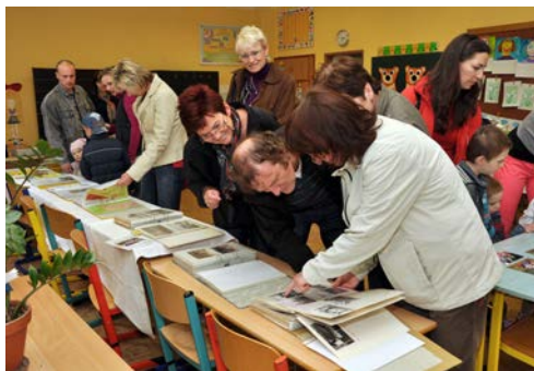
JAK ŠEL ČAS. Velký zájem vzbudila výstava v rámci 50. výročí založení základní školy v Horce nad Moravou.

Sdružení rodičů připravilo pro návštěvníky bohaté občerstvení – nápoje, grilované speciality, cukrovinky. Slavnostní náladu povzbudila country kapela Karanténa. Poslední návštěvníci se rozcházelí až za tmy.