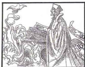
Mistr Jan Hus na kartonu Mikuláše Alše (1895)

Horka nad Moravou sobota 6. července 2013