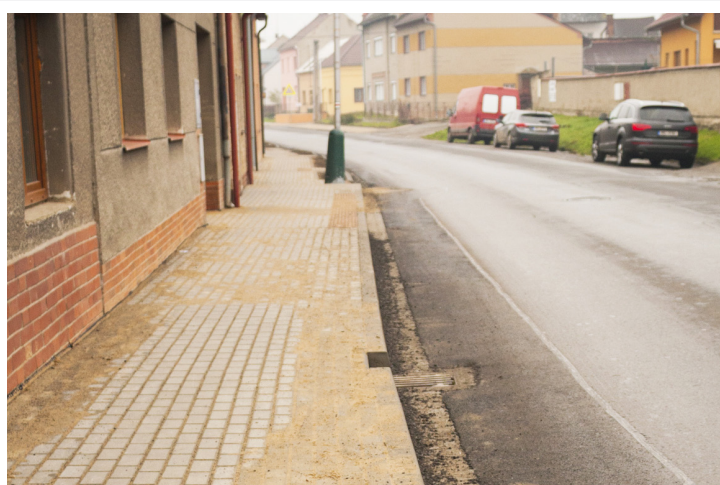
Postupně se daří v Horce nad Moravou budovat chodníky, které velmi výrazně přispějí k bezpečnosti chodců v blízkosti frekventovaných cest. Ostatně je to jedna z priorit, které se chtějí zastupitelé v dalším volebním období věnovat. Na snímku je nově vybudovaný chodník na Skrbeňské ulici. Jeho začátek u kapličky sice ještě není hotov, ale to se dořeší při úpravách prostranství u kapličky.