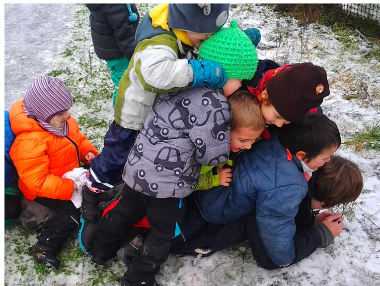
Chlapci a děvčata v lesní školce Bažinka tráví většinu času venku na čerstvém vzduchu. Umí se u toho náramně zabavit, někdy „preperou“ i svého učitele.