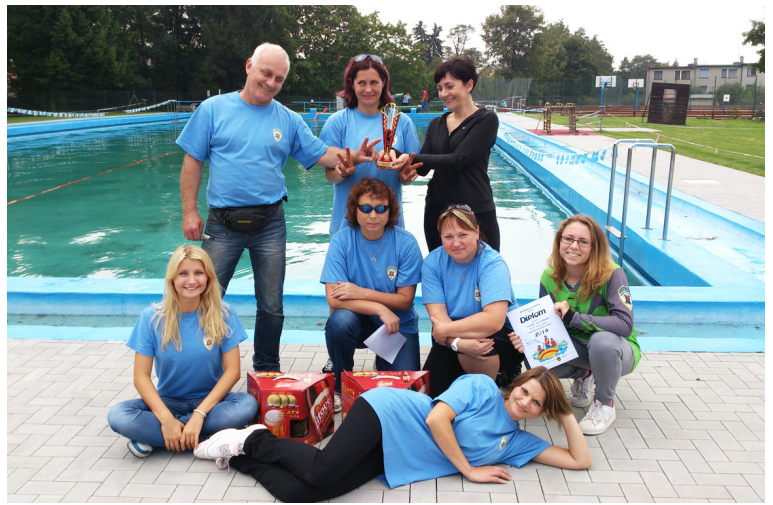
Horecké hasičky se mohou pochlubit 3. místem v „Netradiční hasičské soutěži“.