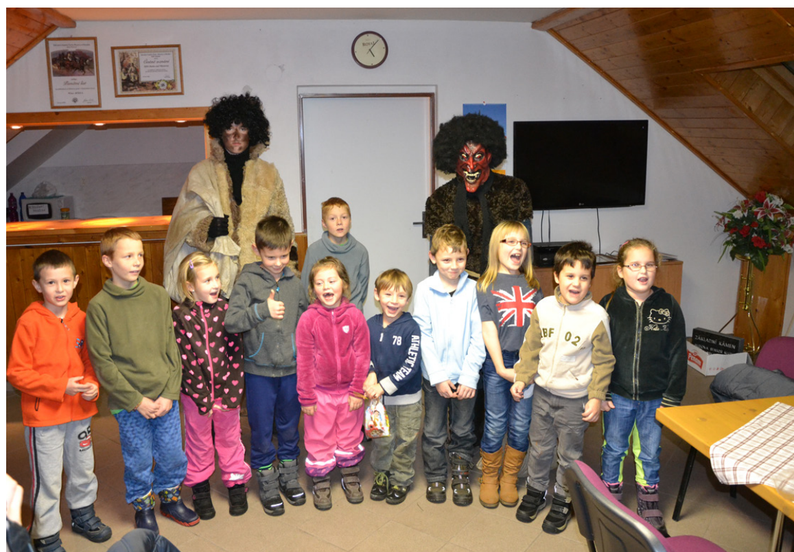
Oddíl mladého hasiče při SDH Horka nad Moravou má dvacet dětí, pro které je připravován celoroční program (podrobnosti přinášíme na straně 8). Mezi chlapce a děvčata nezapomněli přijít 2. 12. 2014 čerti (také Mikuláš).